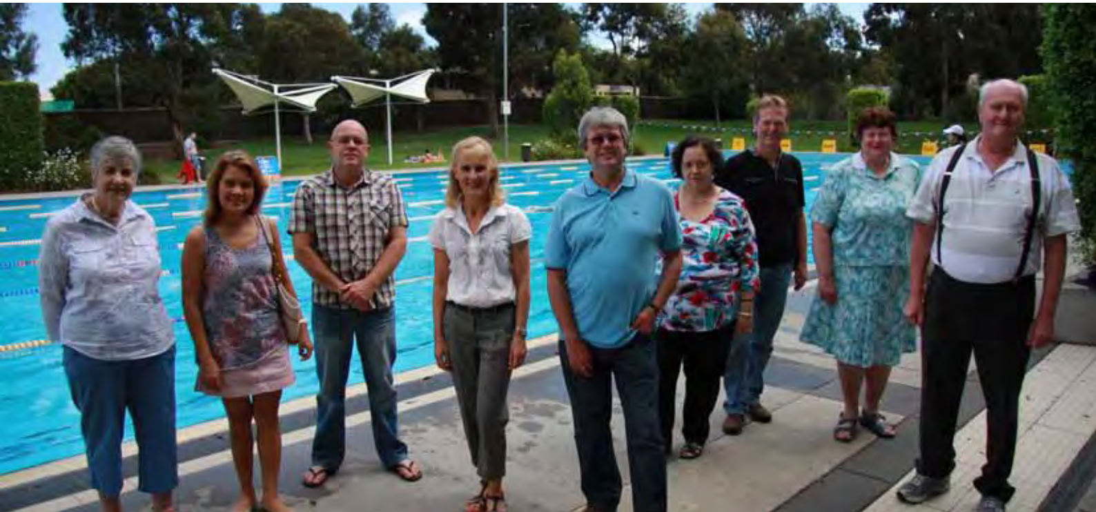
市長 Greg Male 與蒙納士水上娛樂中心基本會員合影。