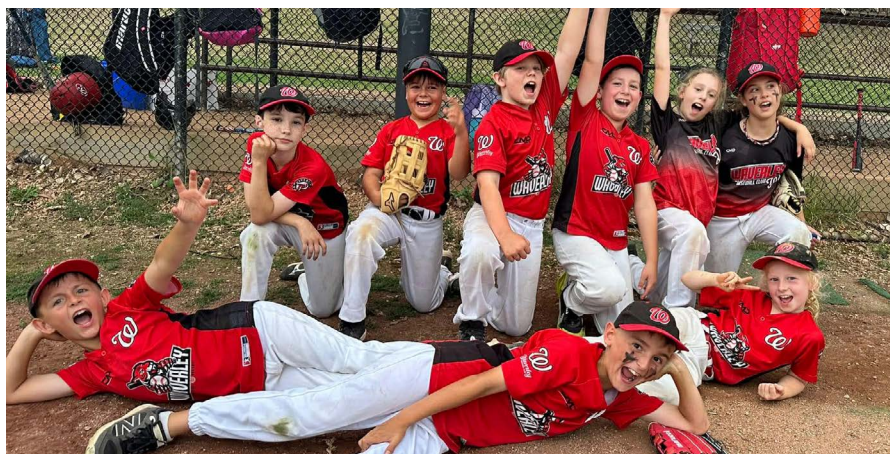
Waverley Baseball Club 一直致力于成为服务社区的体育俱乐部。