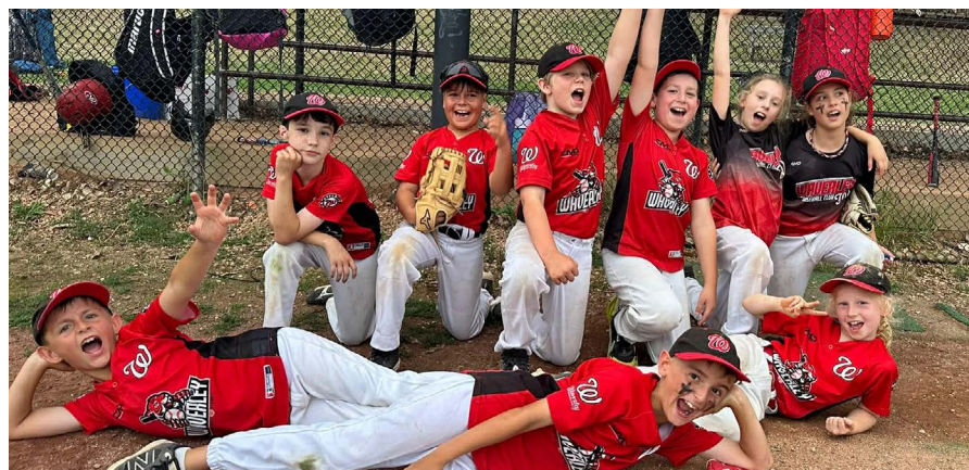
Το Waverley Baseball Club εργαζόταν πάντα σκληρά για να αποτελεί έναν σύλλογο της κοινότητας.