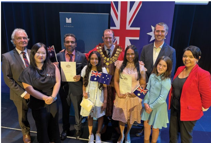
Ήταν τιμή μας να καλωσορίσουμε πρόσφατα εκατοντάδες νέους Αυστραλούς στις τελετές απονομής υπηκοότητας του Monash. Συγχαρητήρια σε όλους τους νέους πολίτες.

Λεπτομέρειες: monash.vic.gov.au/committees