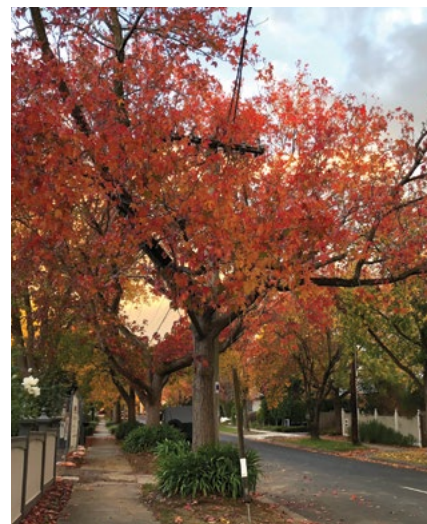
Το φθινόπωρο αναδεικνύει την ομορφιά των δέντρων στους δρόμους μας

Θέλετε να μάθετε περισσότερα; Επισκεφθείτε το monash.vic.gov.au/tree-care